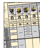
Tabela Matriz de Seleção da Bomba para Torquímetro

Para desempenho e velocidade otimizados, veja a tabela de seleção do torquímetro, bomba e mangueiras.